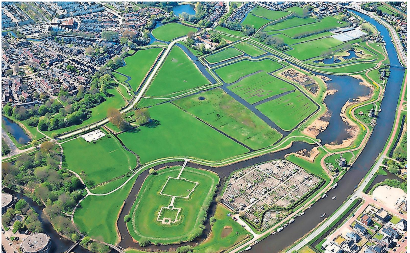
Natuurgebied Oudorperhout, nog net binnen de Westfriese Omringdijk. Links Alkmaar, rechts Oudorp. Door het groen loopt de Munnikenweg. Middenonder zijn de fundamenten te zien van kasteel Nijenburg. Het groene eilandje middenboven is het terrein van de Middelburg.