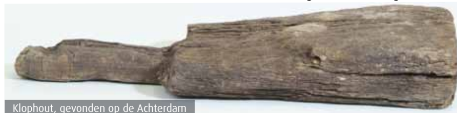
Klophout, gevonden op de Achterdam

Uit ons houtdepot komt een opmerkelijk voorwerp, een klophout. Dit wasattribuut heeft een rechthoekige vorm en een steel. Een klophout werd tot in de negentiende eeuw gebruikt om het vuil uit de was te kloppen. Dit zeventiende-eeuwse exemplaar is in 1989 opgegraven uit een beerput op de Achterdam. De totale lengte van het klophout met steel is 42 cm. Het blad is 14 cm breed en de dikte is gemiddeld 5 cm (het blad loopt taps toe). De houtsoort is niet meer te achterhalen.