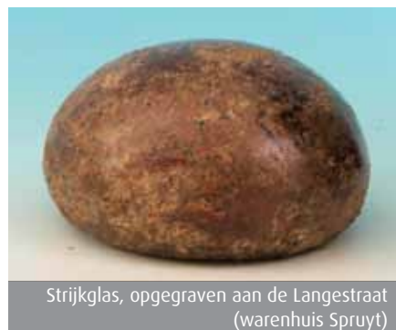
Strijkglas, opgegraven aan de Langestraat (warenhuis Spruyt)

Eén van de vrouwen hangt was op de houten wasrekken en twee dames zijn al bezig met het opvouwen van de was. Vaak werden binnenshuis ook kleine houten wasrekken gebruikt. Dan kon de was, vlakbij de kachel of de haard, goed en snel drogen.