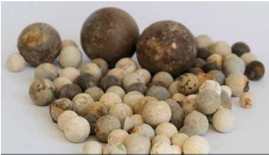
Een grote verzameling achttiende-eeuwse knikkers, samen met tientallen griffels, nagelaten door de schoolkinderen van de Franse school

met een gezamenlijke schoorsteen erop. De achterzijde van het huis is minstens eenmaal herbouwd, waarbij ook een beerput is toegevoegd. Rechts naast dit huis stond een kleiner huis, mogelijk ook al vanaf de vijftiende eeuw. Behalve de oude achtergevel zijn van dit huis alleen funderingen opgegraven die hoorden bij het achterhuis dat er in de zestiende eeuw aan toegevoegd moet zijn. Dit tweede huis had een ondiepe kelder en een beerput aan de achterzijde. De put was, net als een latere beerput ernaast, al in 1985 geleegd.