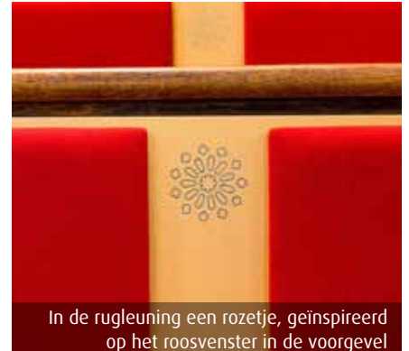
In de rugleuning een rozetje, geïnspireerd op het roosvenster in de voorgevel