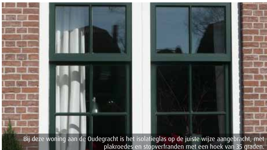
Bij deze woning aan de Oudegracht is het isolatieglas op de juiste wijze aangebracht, met plakroedes en stopverfranden met een hoek van 35 graden.