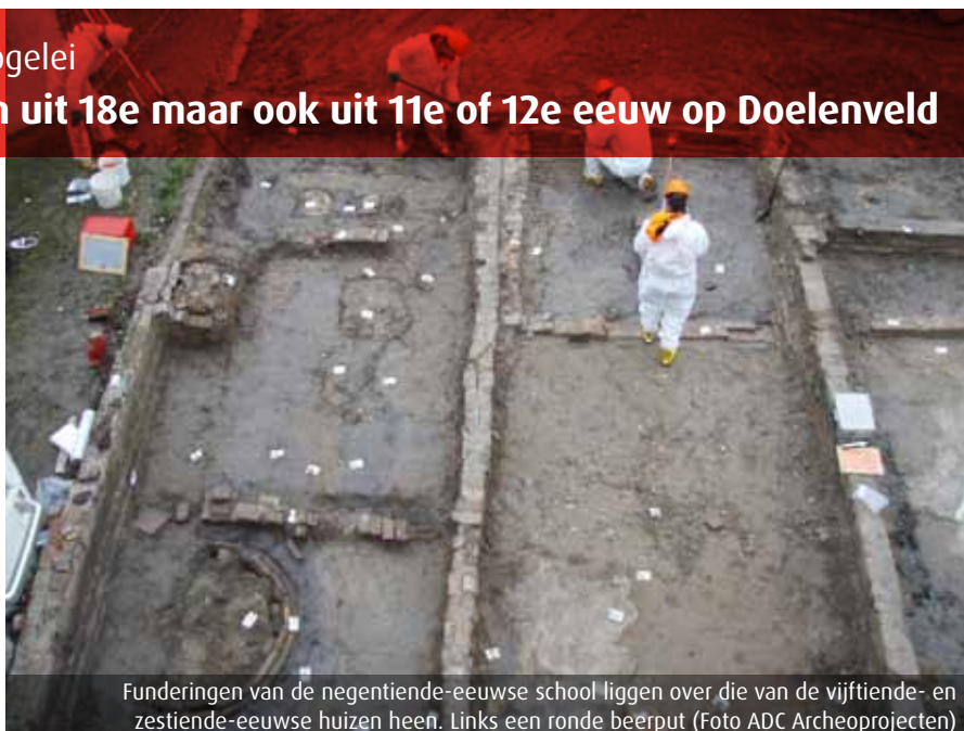
Funderingen van de negentiende-eeuwse school liggen over die van de vijftiende- en zestiende-eeuwse huizen heen. Links een ronde beerput

mingen, waardoor destijds een einde kwam aan bewoning in dit gebied.