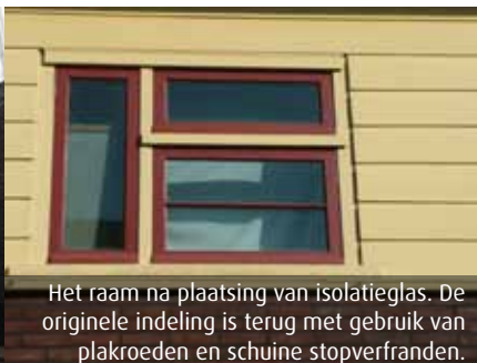
Het raam na plaatsing van Isolatieglas. De originele indeling is terug met gebruik van plakroeden en schuine stopverfranden.