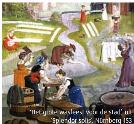
'Het grote wasfeest voor de stad', uit 'Splendor solis', Nürnb. 153

Het klophout was dus vast onderdeel van het wasproces. Eeuwen lang werd de was gedaan aan de oever van een rivier. Dit is terug te zien in de miniatuur op deze pagina waarop wasvrouwen nijver aan het werk zijn. In het riviertje wordt de was gedaan en links zien we een grote ketel op het vuur. In deze keten wordt de witte was gekookt. De grote tobben werden gebruikt als wastobbe en waarschijnlijk ook als mand om de was in te vervoeren.