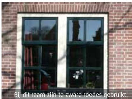
Bij dit raam zijn te zware roedes gebruikt.

In oude panden heb je soms het idee dat het binnen net zo hard waait als buiten. Vooral bij de ramen is die 'natuurlijke ventilatie' sterk. Niet alleen de kieren maar ook het oude dunne glas zelf zorgt voor kou. Maar gelukkig kun je ook in oude panden goed en verantwoord isolatieglas aanbrengen. Er zijn een paar dingen waar je op moet letten en in sommige gevallen is subsidie mogelijk. Monumentenzorg geeft graag advies op maat.