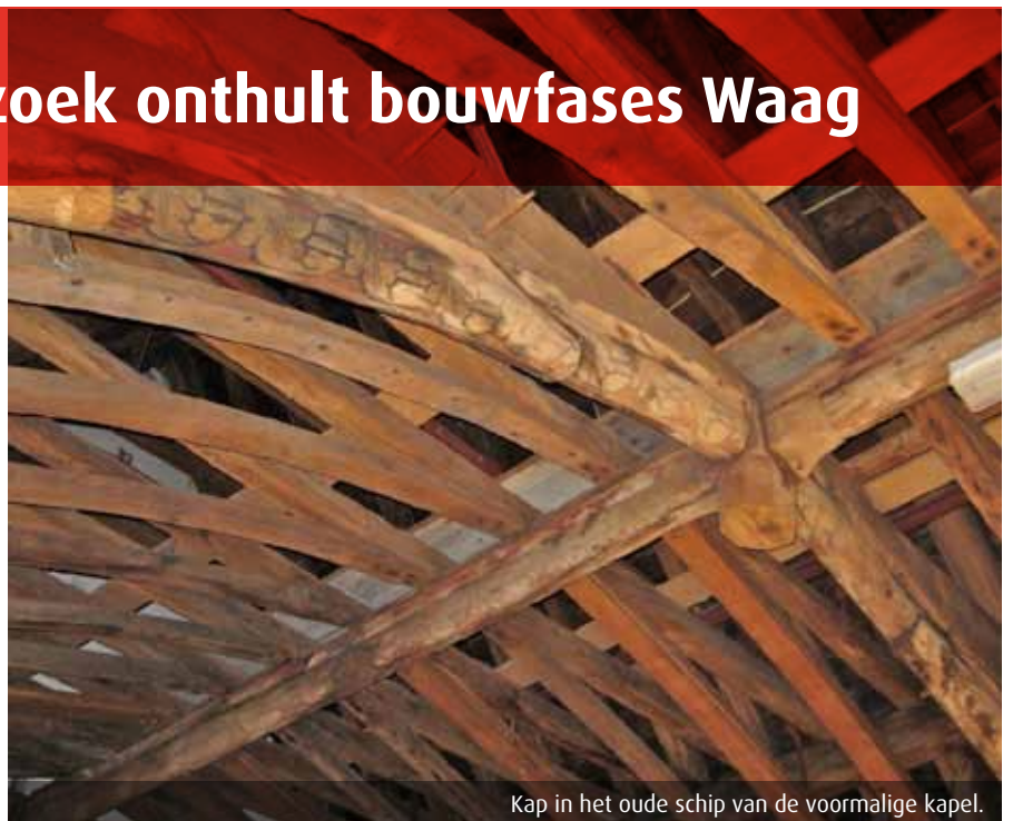
Kap in het oude schip van de voormalige kapel.

Het westelijke schip werd in 1597 met houten vloeren verdeeld in drie lagen. De begane grond, waar nu de VVV gevestigd is, werd een vleeshal. De eerste verdieping en de zolder (nu in gebruik voor het kaasmuseum) waren voor de stadskoren. De constructie bestaat uit eiken balklagen met onderslagen op standvinken met zwanenhalskorbelen. De huidige toren, steunend op vier pijlers in de kruising van de voormalige kapel, behoort ook tot deze bouwfase. Na de laat negentiende-eeuwse herstellingen en aanpassingen door Ducroix was er nog een grote restauratie in 1958, naar de plannen van Royaards.