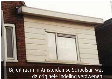
Bij dit raam in Amsterdamse Schoolstijl was de originele indeling verdwenen.