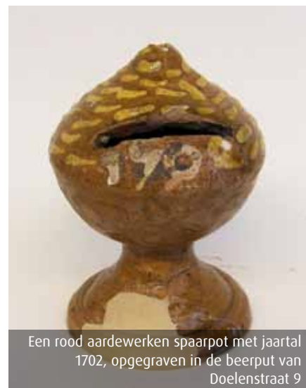
Een rood aardewerken spaarpot met jaartal 1702, opgegraven in de beerput van Doelenstraat 9

schieten oefende op het Doelenveld. Enige tijd later volgde een tweede schuttersvereniging, die de 'Jonge Doelen' stichtte. Het gebouw van de Oude Doelen (nummers 21 en 23) maakte in 1903 plaats voor een nieuw gebouw waarin de Wilhelminaschool gevestigd werd.