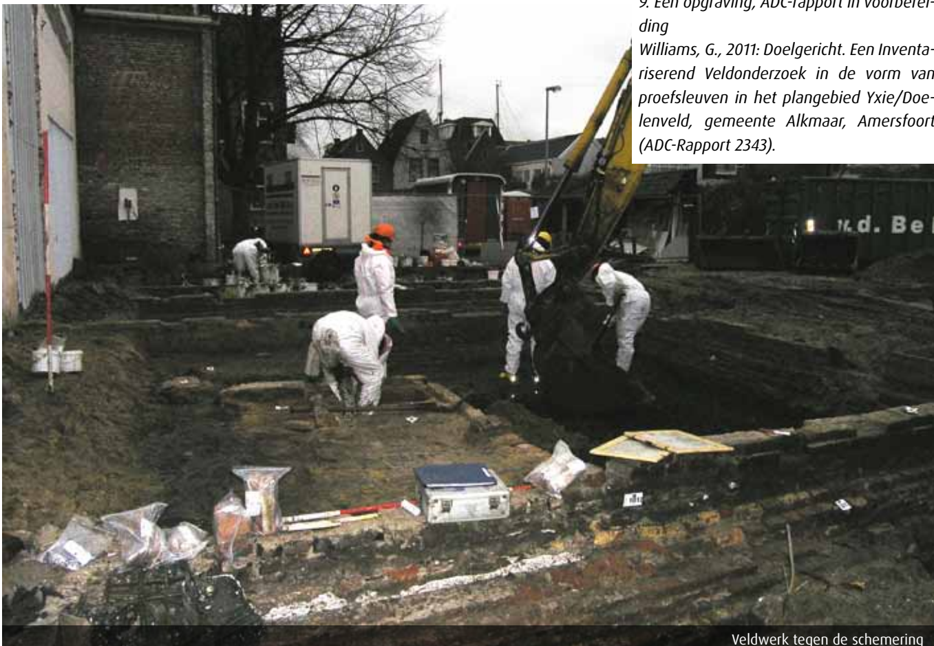
Veldwerk tegen de schemering

Williams, G., 2011: Doelgericht. Een Inventariserend Veldonderzoek in de vorm van proefsleuven in het plangebied Yxie/Doelenveld, gemeente Alkmaar, Amersfoort (ADC-Rapport 2343).