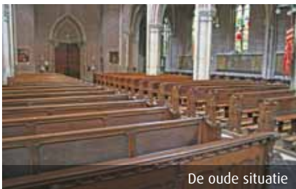
De oude situatie

granietegels uit de jaren zestig van de vorige eeuw die eigenlijk niet bij de overige vloeren pasten. Om meer ruimte te maken, zijn de houten vlonders en stoelen tussen het midden- en het hoofdaltaar verwijderd. Ook dit gedeelte heeft een vloer van Belgisch hardsteen gekregen. Onder dit gedeelte is de oude kerkvloer gevonden, een vloer van zwarte keramische tegels van 20 x 20 cm.