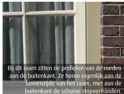
Bij dit raam zitten de profielen van de roeden aan de buitenkant. Ze horen eigenlijk aan de binnenzijde van het raam, met aan de buitenkant de schuine stopverfranden.

In oude panden heb je soms het idee dat het binnen net zo hard waait als buiten. Vooral bij de ramen is die 'natuurlijke ventilatie' sterk. Niet alleen de kieren maar ook het oude dunne glas zelf zorgt voor kou. Maar gelukkig kun je ook in oude panden goed en verantwoord isolatieglas aanbrengen. Er zijn een paar dingen waar je op moet letten en in sommige gevallen is subsidie mogelijk. Monumentenzorg geeft graag advies op maat.