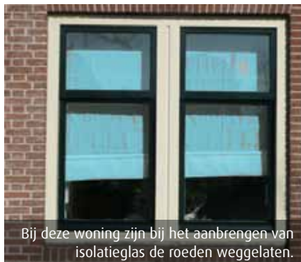
Bij deze woning zijn bij het aanbrengen van isolatieglas de roeden weggelaten.

Wat te doen als het raamhout verrot is, of in het verleden bij een verbouwing verwij-