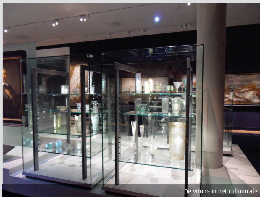
De vitrine in het cultuurcafé

daar twee historische massagraven aan. In de presentatie zijn vier van de gevonden skeletten te zien en een schedel met een kogelgat (zie ook het artikel op pagina 4).