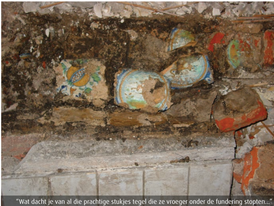
“Wat dacht je van al die prachtige stukjes tegel die ze vroeger onder de fundering stopten...”

die mooie balken die er onder vandaan kwamen. Ze zijn pas langs geweest voor dendrochronologisch onderzoek* (jaarringenonderzoek, red.). Dan doen ze een boring in het hout en dan kunnen ze precies zien hoe oud het is. Daar krijg ik binnenkort de uitslag van.”