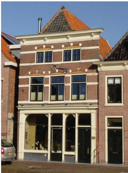
In het pand aan het Verdronkenoord, was vroeger bakkerij De Blanken gevestigd

"Toen we dit pand kochten, woonden we in Alkmaar Noord, in een rijtjeshuis waar ik in de loop der jaren een soort atelier van had gemaakt. Het werd steeds voller. De schilderijen hingen aan het plafond. Daarnaast verzamelde ik ook nog van alles. Maar ik wilde ook graag een mooi huis en liever dus