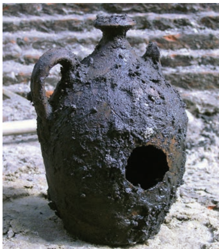
Een iberische olijfoliekuik, midden zeventiende eeuw, gevonden in Hofstraat 17

Rond die tijd is het huisje gesloopt en herbouwd, deels op de oude funderingen. In de gedempte bedsteekelder werd onder meer een scherf gevonden met het jaartal 1603. In de kap van de synagoge, die in de eerste helft van de negentiende eeuw werd gebouwd, zijn zeven hergebruikte eiken balken gevonden die afkomstig zullen zijn van het 'nieuwe' huis dat er toen nog stond. Dankzij specialistisch houtonderzoek door dendrochronologen is de kapdatum van de vier gebruikte bomen bepaald en het blijkt dat de jongste balk inderdaad van na 1596 is.