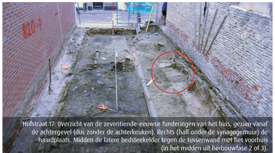
Hofstraat 17: overzicht van de zeventiende-eeuwse funderingen van het huis, gezien vanaf de achtergevel (dus zonder de achterkeuken). Rechts (half onder de synagogemuur) de haardplaats. Midden de latere bedsteekelder tegen de tussenwand met het voorhuis (in het midden uit herbouwfase 2 of 3).

Van de synagoge zijn drie bouwcampagnes bekend: in 1826, 1844 en 1883. Van de eerste is niet duidelijk wat er toen is neergezet. Bij de tweede kreeg het pand zijn huidige contouren en bij de derde werden vensters vervangen en moest er veel worden hersteld omdat het pand ernstig aan het verzakken was. Dat laatste werd veroorzaakt doordat de zuidmuur alleen in het midden rustte op de oude zeventiende-eeuwse muurresten van Hofstraat 17. De slechte ondergrond aan de voor- en achterkant van de synagoge leidde tot forse ongelijke verzakkingen. De voorkant is namelijk 6 cm en de