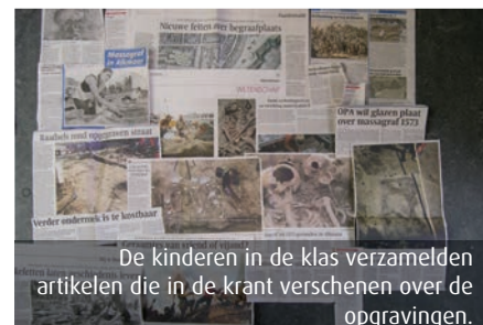
De kinderen in de klas verzamelden artikelen die in de krant verschenen over de opgravingen.

Ook naar aanleiding van ons onderzoek, hebben veel kinderen en hun ouders dit jaar écht 8 oktober gevierd en is zelfs een aantal kinderen en ouders naar het Stedelijk museum geweest...”