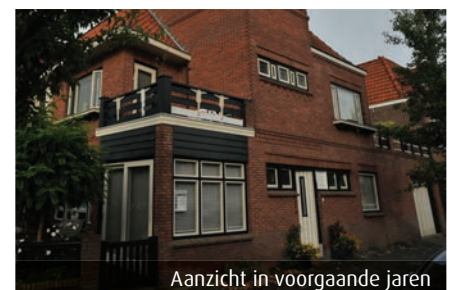
Aanzicht in voorgaande jaren

Gelukkig wordt in deze tijd weer meer aandacht geschonken aan de historische kleur van gebouwen. Waar mogelijk worden de originele tinten, na kleuronderzoek weer op het gebouw toegepast.