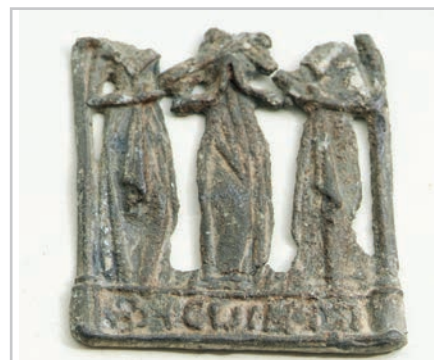
Pelgrimsinsigne gevonden bij de Wortelsteeg

Het insigne meet 3,2 cm maar was aanvankelijk hoger. Helaas ontbreekt het bovenstuk met de hoofden van de dames en het bevestigingsgooje. Op het pelgrimsinsigne een onduidelijk randschrift, waar wel de naam Cunera uit opgemaakt kan worden. Een nog compleet exemplaar met dezelfde afmeting, uit de periode 1450-1500 is gevonden in Arnhem. Het heeft een treffende gelijkenis met het Alkmaarse insigne en geeft een goed idee hoe dit eruit heeft gezien. Beide insignes vertellen het verhaal van de martelaarschap van de heilige Cunera, beschermheilige op