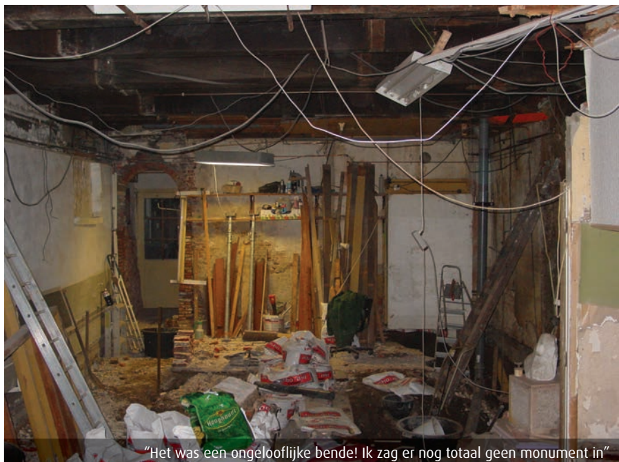
"Het was een ongelooflijke bende! Ik zag er nog totaal geen monument in"

Ik ben een fantaseschilder en dit huis zag ik als een doek met heel veel achtergrond. Die ben ik langzamerhand gaan invullen. Met gebruik van allerlei oude materialen. Dat deurtje achter je, stond een keer ergens langs de weg. En zo zijn er veel meer dingen. Toen het vloerhout binnenkwam, bedacht ik opeens dat ik er liever een plafond van