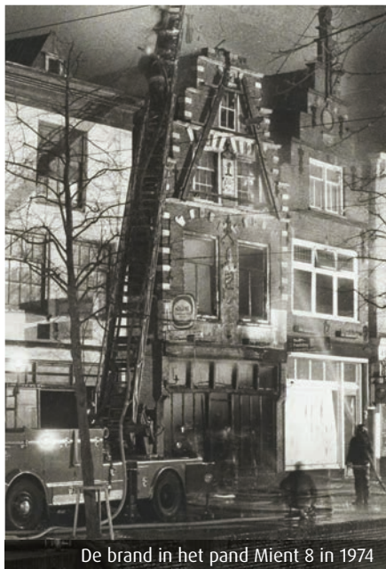
De brand in het pand Mient 8 in 1974

Dendro betekent boom en dendrochronologisch onderzoek is onderzoek naar de leeftijd van houten balken door het bestuderen van jaarringen. Specialisten op dit gebied nemen monsters van constructiehout en vergelijken vervolgens de variaties tussen brede en smalle jaarringen (goede of minder goede groei). Met behulp van de beschikbare referentiekalenders kan daarmee de balk worden gedateerd. Als naast voldoende kernringen ook de buitenste spintringen nog volledig aanwezig zijn, kan zelfs het jaargetijde worden vastgesteld waarin de boom destijds is gekapt.