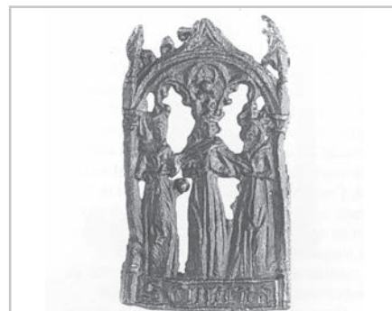
Het in Arnhem gevonden insigne heeft een treffende gelijkenis met het Alkmaarse

het gebied van veeziekten en keelziekten.