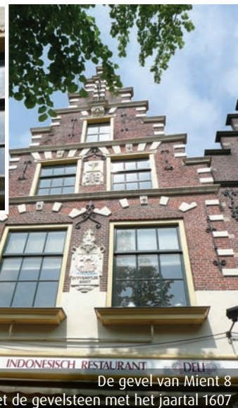
De gevel van Mient 8 Inzet de gevelsteen met het jaartal 1607