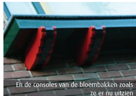
En de consoles van de bloembakken zoals ze er nu uitzien

Het resultaat, een totaal van architectuur, schilderwerk, glas-in-loodramen en rode baksteen met de in Alkmaar unieke witte stootvoegen, vormt nu weer een waarlijk 'Gesamtkunstwerk', zoals het ooit door de architecten moet zijn bedoeld. Het hoekpand, dat samen met de drie naastgelegen panden aan het Nassauplein en door de architecten Van Reijendam ontwor-