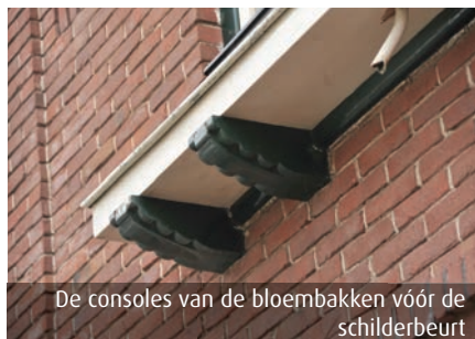
De consoles van de bloembakken vóór de schilderbeurt

Om de oorspronkelijke kleuren te vinden, heeft de vakgroep Monumentenzorg een sporenonderzoek gedaan. Een specifiek okergeel is hierbij als originele kleur teruggevonden, evenals een warme kleur groen. Beide kleuren blijken precies aan te sluiten bij de kleuren van de glas-in-loodramen. De kleuren zwart en oranje-rood voor de voor-