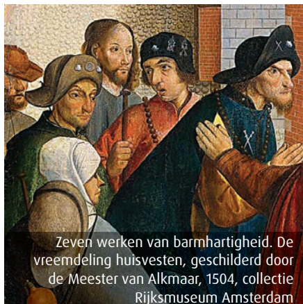
Zeven werken van barmhartigheid. De vreemdeling huisvesten, geschilderd door de Meester van Alkmaar, 1504, collectie Rijksmuseum Amsterdam

In het metaaldepot van het archeologisch centrum worden verschillende insignes bewaard, waaronder een aantal pelgrimsinsignes. Ze hebben vaak de afbeelding van een heilige en werden vroeger op de kleding, hoed of tas van de pelgrim bevestigd. Deze keer in deze rubriek aandacht voor een bijzonder pelgrimsinsigne, dat in 1991 gevonden werd bij de Alkmaarse Wortelsteeg.