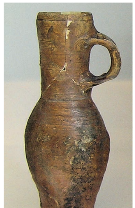
Een zeldzame Siegburg Jacobakan van steengoed met bruine glazuurlaag. Samen met de kookpot van de voorpagina gevonden in een kuil met veengruis onder Hofstraat 17 (beide uit circa 1350-1425)

achterkant 15 cm dieper gezakt dan het middendeel. Het achterste deel van deze zijmuur is naderhand (waarschijnlijk in 1883) aan de binnenzijde verstevigd tot bijna een meter dikte. Gelukkig staat het pand nu weer stabiel.