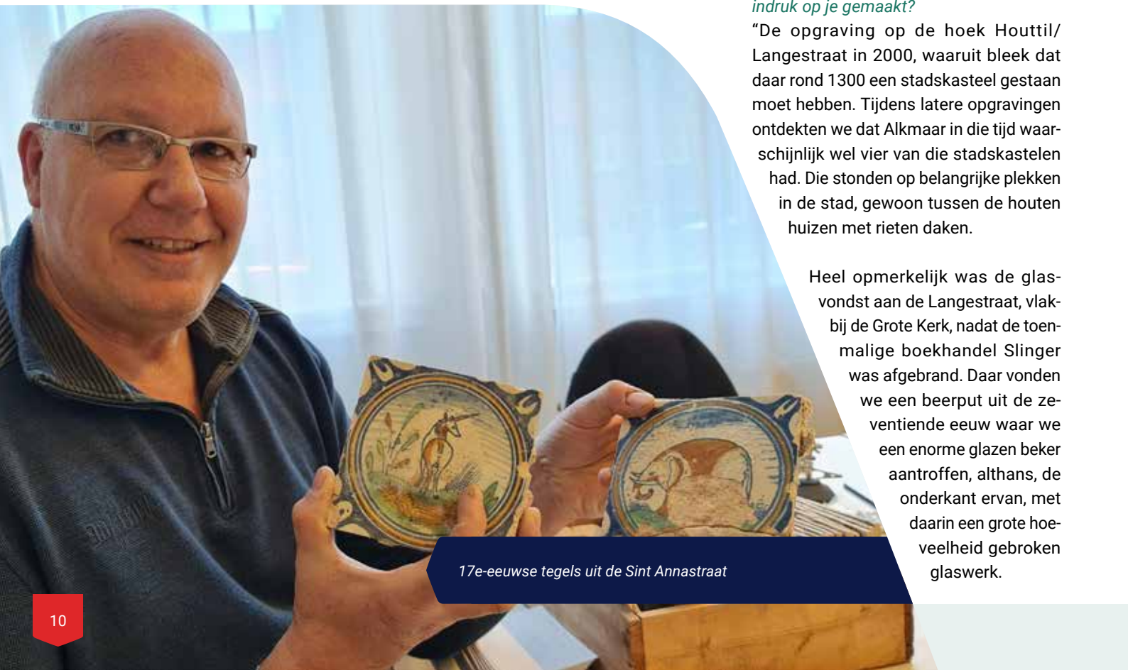
17e-eeuwse tegels uit de Sint Annastraat

Heel opmerkelijk was de glasvondst aan de Langestraat, vlakbij de Grote Kerk, nadat de toenmalige boekhandel Slinger was afgebrand. Daar vonden we een beerput uit de zeventiende eeuw waar we een enorme glazen beker aantreffen, althans, de onderkant ervan, met daarin een grote hoeveelheid gebroken glaswerk.