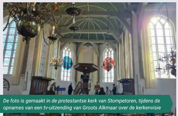
De foto is gemaakt in de protestantse kerk van Stompvoren, tijdens de opnames van een tv-uitzending van Groot Alkmaar over de kerkvisie

Het platform is te vinden via kerkenplatformalkmaar.nl .