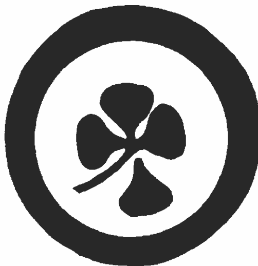
H 729, 1931. Klavertje vier met één vallend blad.