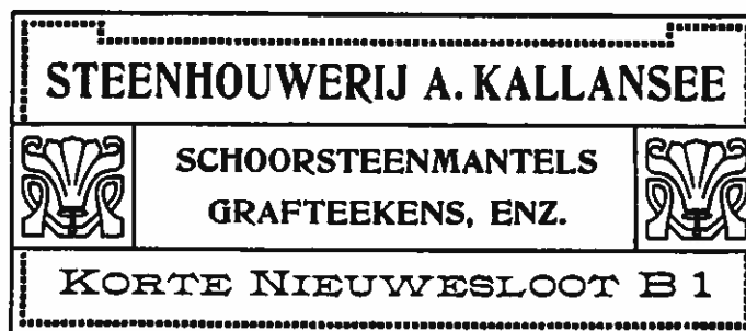
Advertenties van Alkmaarse steenhoudersbedrijven uit Alkmaarse adressenboekjes.