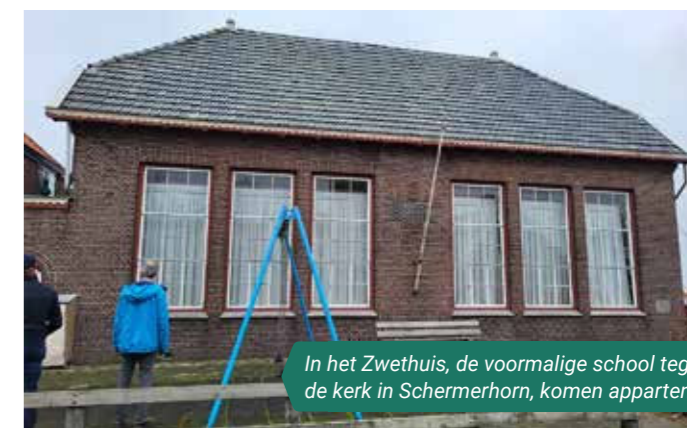
In het Zwethuis, de voormalige school tegenover de kerk in Schermerhorn, komen appartementen.

Woningen in die kerk bouwen, zou zonde zijn, dan doe je het gebouw zoveel onrecht aan!