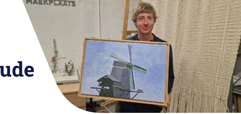
Berend Post maakte tekeningen van alle beschreven ambachten en een schilderij van de voormalige houtzaagmolen.

verhalen opgehaald bij de archeologen, om zo de makersgeschiedenis in beeld te brengen.