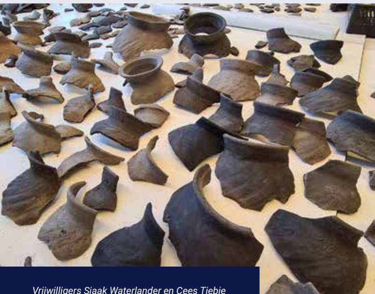
Vrijwilligers Sjaak Waterlander en Cees Tiebie sorteren de gevonden resten van de kogelpotten.