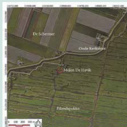
Het onderzoeksgebied met centraal molen De Havik.