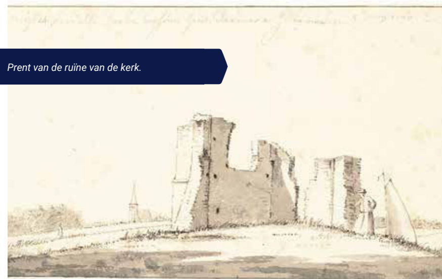
Prent van de ruïne van de kerk.

De vraag blijft wat de oudste nederzetting is die op het Schermereiland gestaan heeft en waar die precies te vinden is. Een helpende hand komt mogelijk uit een oorkonde uit de elfde eeuw van het Klooster van Echternach in Luxemburg. Deze oorkonde