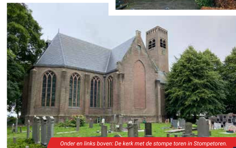
Onder en links boven: De kerk met de stompe toren in Stompeteren. Rechts boven: De kerk aan het Westeinde in Schermerhorn.