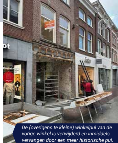
De (overigens te kleine) winkelpui van de vorige winkel is verwijderd en inmiddels vervangen door een meer historische pui.