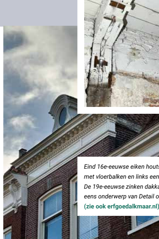
Eind 16e-eeuwse eiken houtskeletbouw, met vloerbalken en links een muurstijl. De 19e-eeuwse zinken dakkapel was al eens onderwerp van Detail op Dinsdag (zie ook erfgoedalkmaar.nl )

Lees het volledige interview en meer bouwgeschiedenis op erfgoedalkmaar.nl