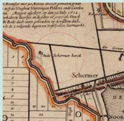
Kaart van de Schermer uit 1635. In de rode cirkel moet de oude kerk van Schermer hebben gestaan. (Het kaartje is trouwens 'op zijn kop' getekend. Het noorden zit hier niet boven, zoals wij gewend zijn)

uit 1063 is een bezittingenlijst van het klooster. En in dit document wordt een kerk in Skirmere/Scirmere genoemd. Wat dus aangeeft dat er in die periode op het Schermereiland waarschijnlijk al een kerk of kapel stond. Waarschijnlijk in de directe omgeving van Grootchermer. Dat laatste is te lezen in de Lexicon van Nederlandse toponiemen tot 1200, van Künzel, R.E., D.P. Blok & J.M. Verhoeff.